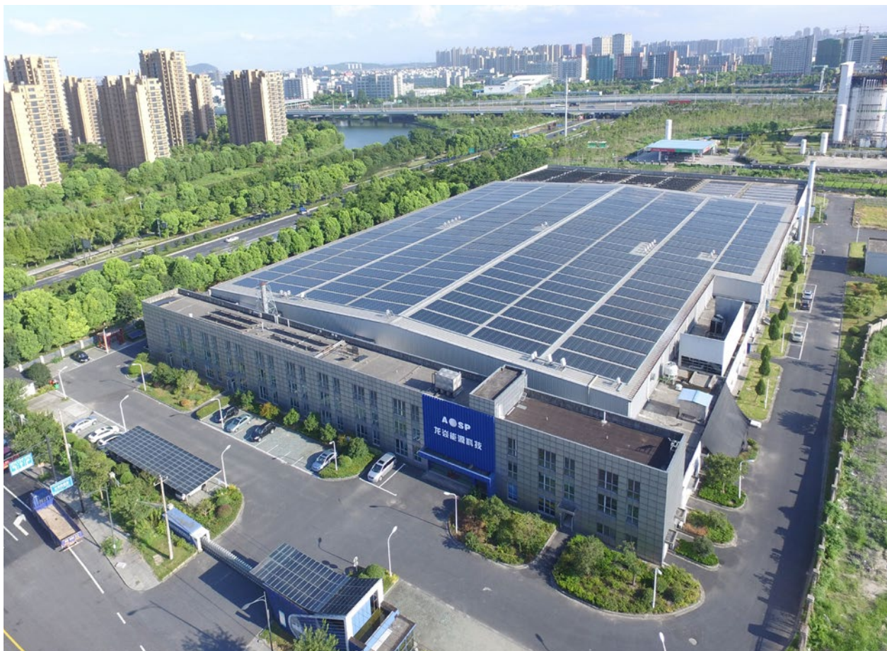
En av ASRE:s anläggningar i Kina om 1 MW, installerad på Advanced Solar Power Hangzhous fabrik.

på världens största tillväxtmarknad. I Kina gör solenergi dessutom mest miljönytta då den ersätter kolkraftsproducerad energi. Genom brukande av kapitalet från obligationen samt tidigare tillfört kapital från SolTech och ASP, beräknas den totala installerade, och till elnätet anslutna kapaciteten uppgå till omkring 44 MW vid halvårsskiftet 2018.