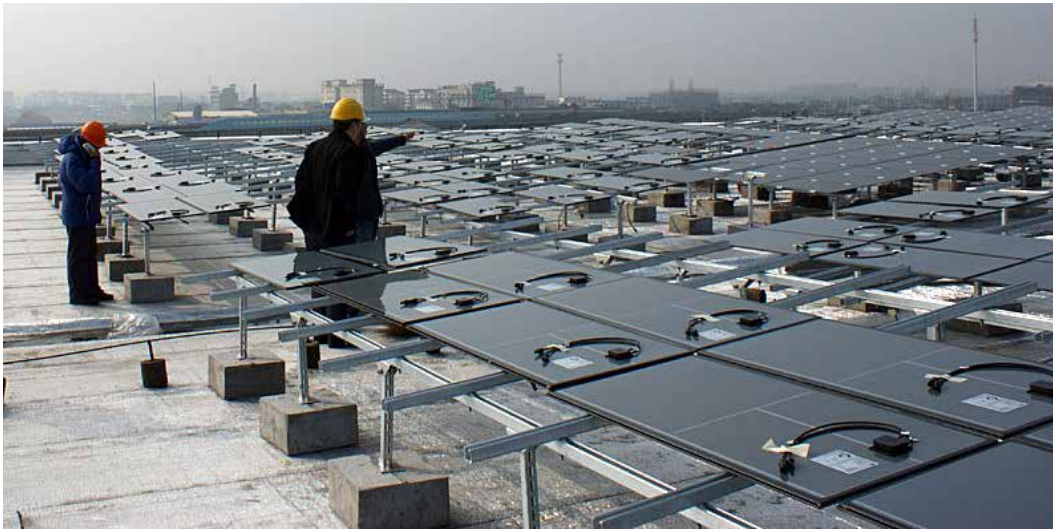
En av ASRE:s anläggningar – NingBo General Mechanical Plastic MachineFactory, 690 KW - under byggnation

ASRE har som uppföljning på det strategiska avtalet med HeNan Provincial Energy Conservation Co. Ltd., tecknat avtal om ytterligare en anläggning på motsvarande 3-5 MW. Anläggningen beräknas generera årliga intäkter för ASRE motsvarande 5,25-8,74 MSEK. Under avtalets 20-åriga löptid beräknas de ackumulerade intäkterna uppgå till cirka 105-175 MSEK. Investeringen i anläggningen, som ägs av ASRE, uppgår till mellan 30-50 MSEK beroende av hur stor anläggningen slutligen blir.