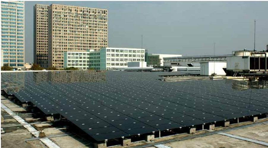
En av ASRE:s anläggningar – Terumo, 325 KW – driftsatt

genom utgivande av en företagsobligation. I enlighet med planen avser SolTech Energy erbjuda marknaden en obligation för detta ändamål under våren 2016. Specifik information rörande detta kommer att publiceras i närtid.