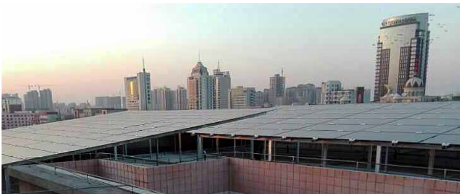
En av ASRE:s anläggningar – Kai Feng City Government, 285 KW – driftsatt.