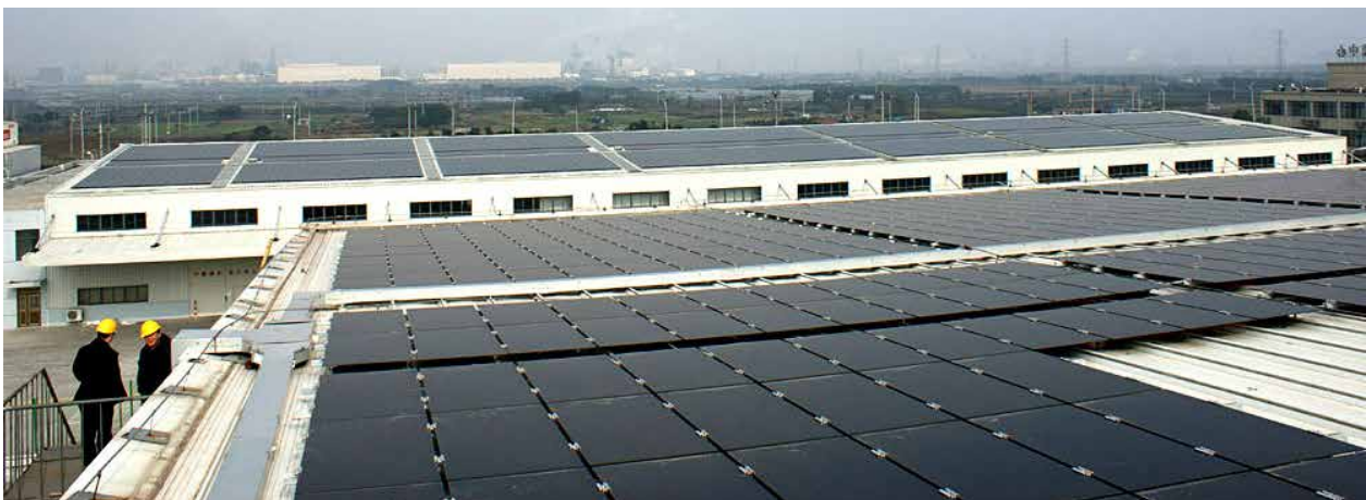
En av ASRE:s anläggningar – NingBo Cold GoodStorage, 960 KW – driftsatt