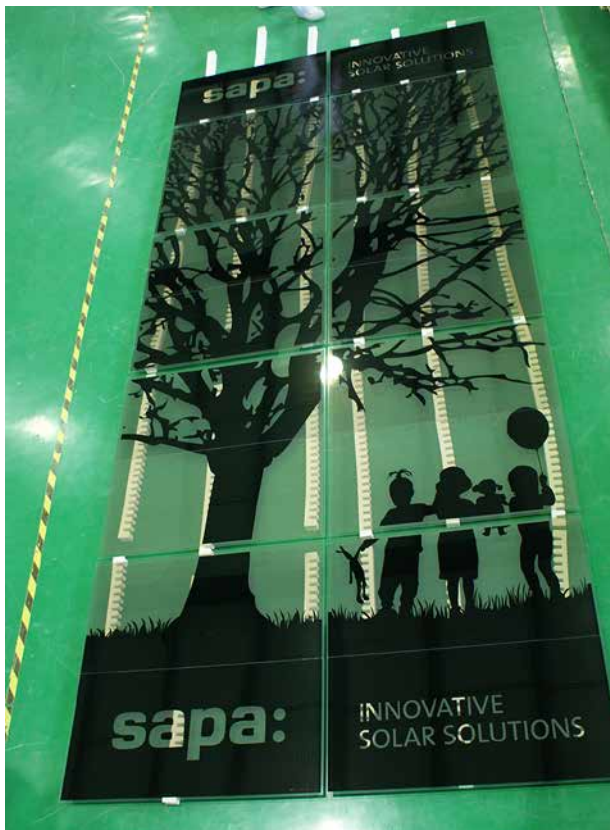
SolTech ST, specialgjord solcell för SAPA.

Sapa BuildingSystems AB ingår i den världsomfattande koncernen Sapa A/S med huvudkontor i Oslo, som ingår i Sapa Group med en årsomsättning på cirka 44 miljarder NOK.